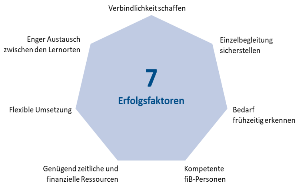
Abbildung 4. Grafik INFRAS.

Aus den Evaluationsergebnissen lassen sich sieben Faktoren für eine wirksame fiB ableiten: